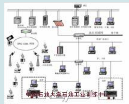
油田信息化架构拓扑图