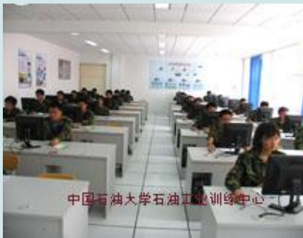
油田信息软件编程训练室