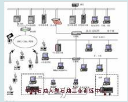
油田信息化架构拓扑图