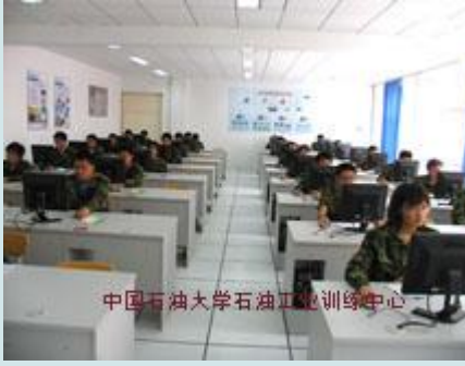
油田信息软件编程训练室